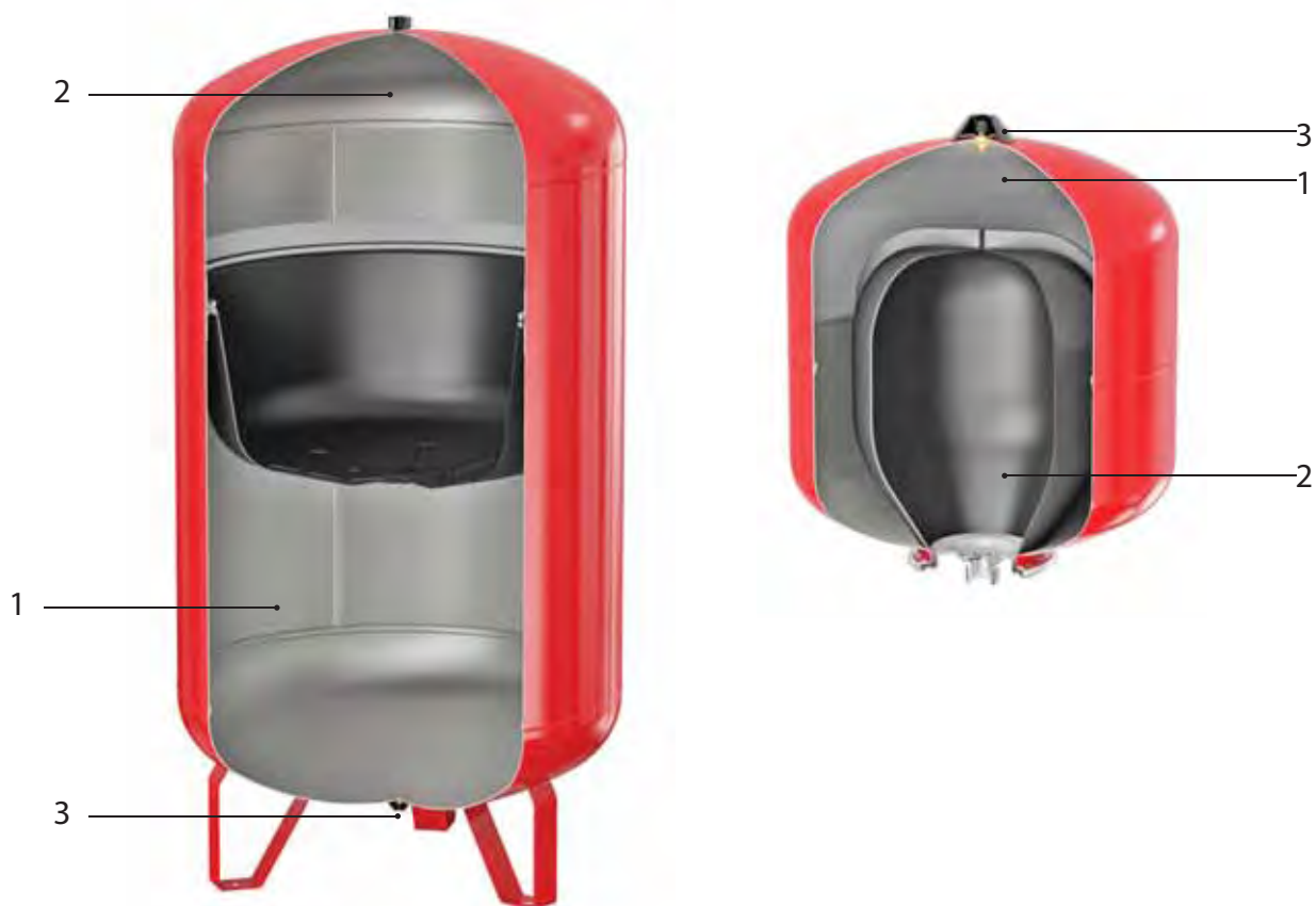
Рис. 1 Мембранные расширительные баки «Гранлевел»

Теплоносителем может служить этиленгликолевая смесь с концентрацией не более 50 %.